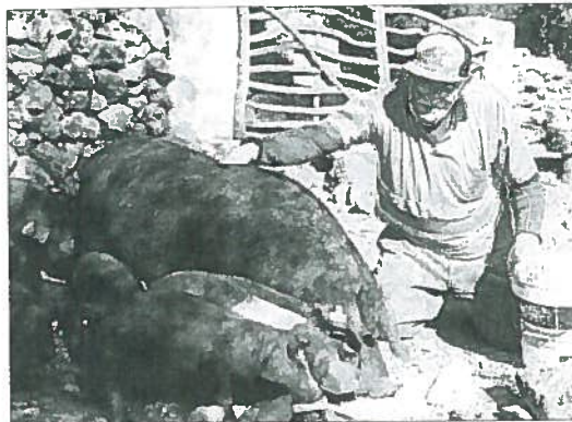
Preparativos. En la imagen superior, el cerdo que se sorteará por Sant Antoni, cuyo peso ronda los 100 kilos. Abajo, la Contramurada a punto para la feria.

Dentro del programa de actos de San Antoni, cabe destacar la celebración mañana de una torrada solidaria, a partir de las 19 horas en la zona de Ses Voltes, cuya recaudación se destinará en su tercera edición a Cruz Roja del municipio.