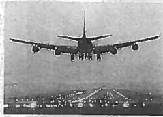
El Govern balear ha d'enllestir els documents per presentar la tarifa plana a la Unió Europea

El Cercle d'Economia de Menorca, com integrant ben representatiu de la societat civil menorquina dona ampli suport als partits pol3tics i al Parlament balear i fa sentir de nou la seva veu en aquests temes i m3s, per tractar-se d'una qüestió de tanta importància i tan llargament reclamada.