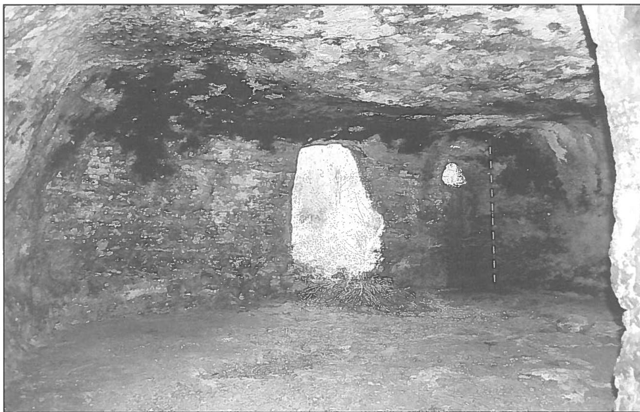
Na Bri, Santanyí. El portal des de l'interior.