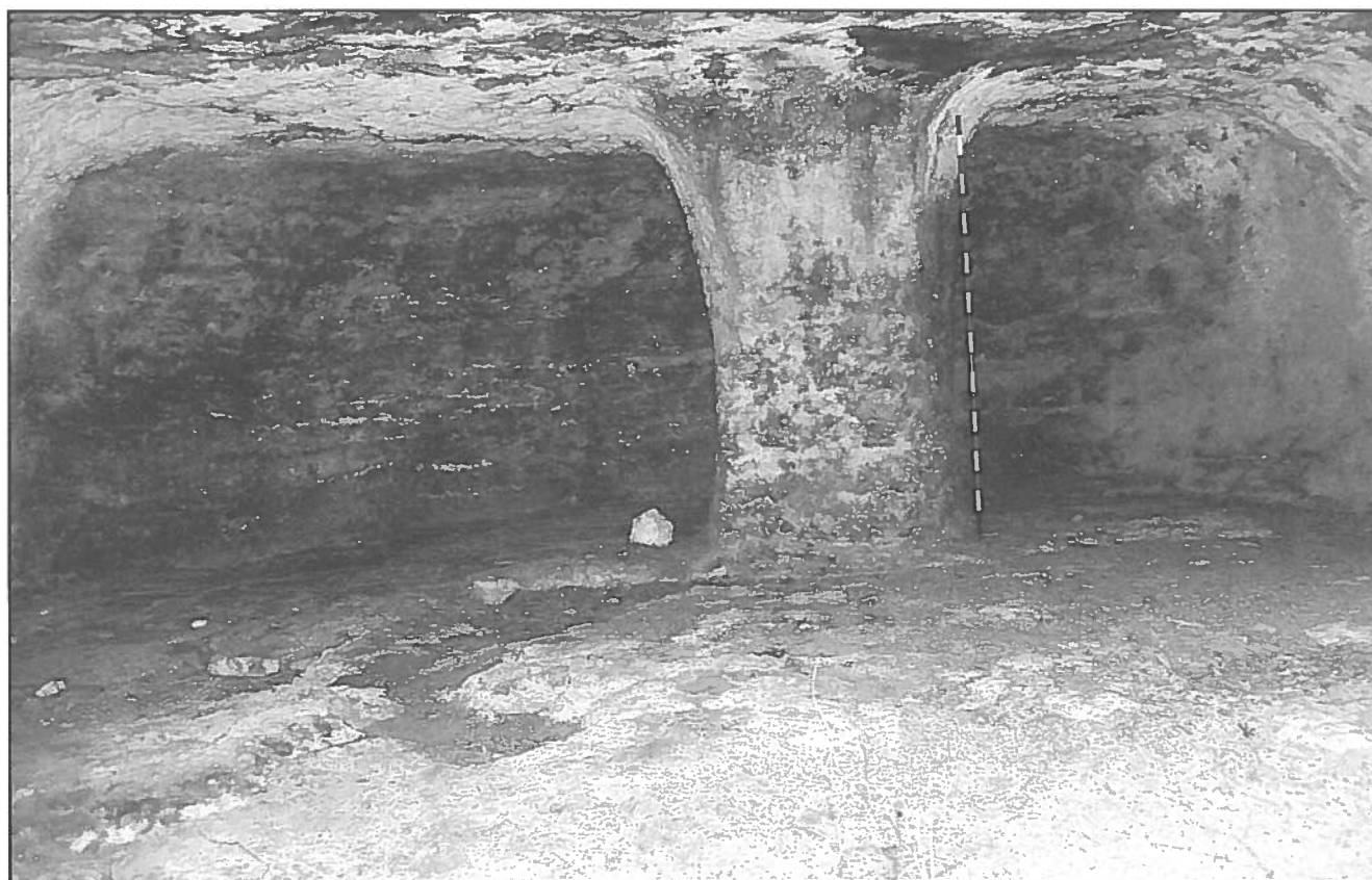
Na Bri, Santanyí. Pilastra exempta al fons de la cova.