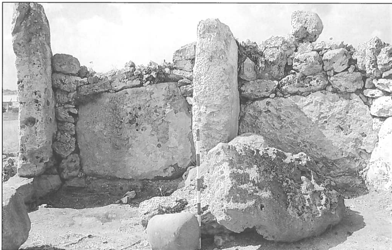
Pedra ovoide de les mateixes característiques que les anteriors, fora de context, a l'interior del Monument 2 de So Na Caçana (Alaior).