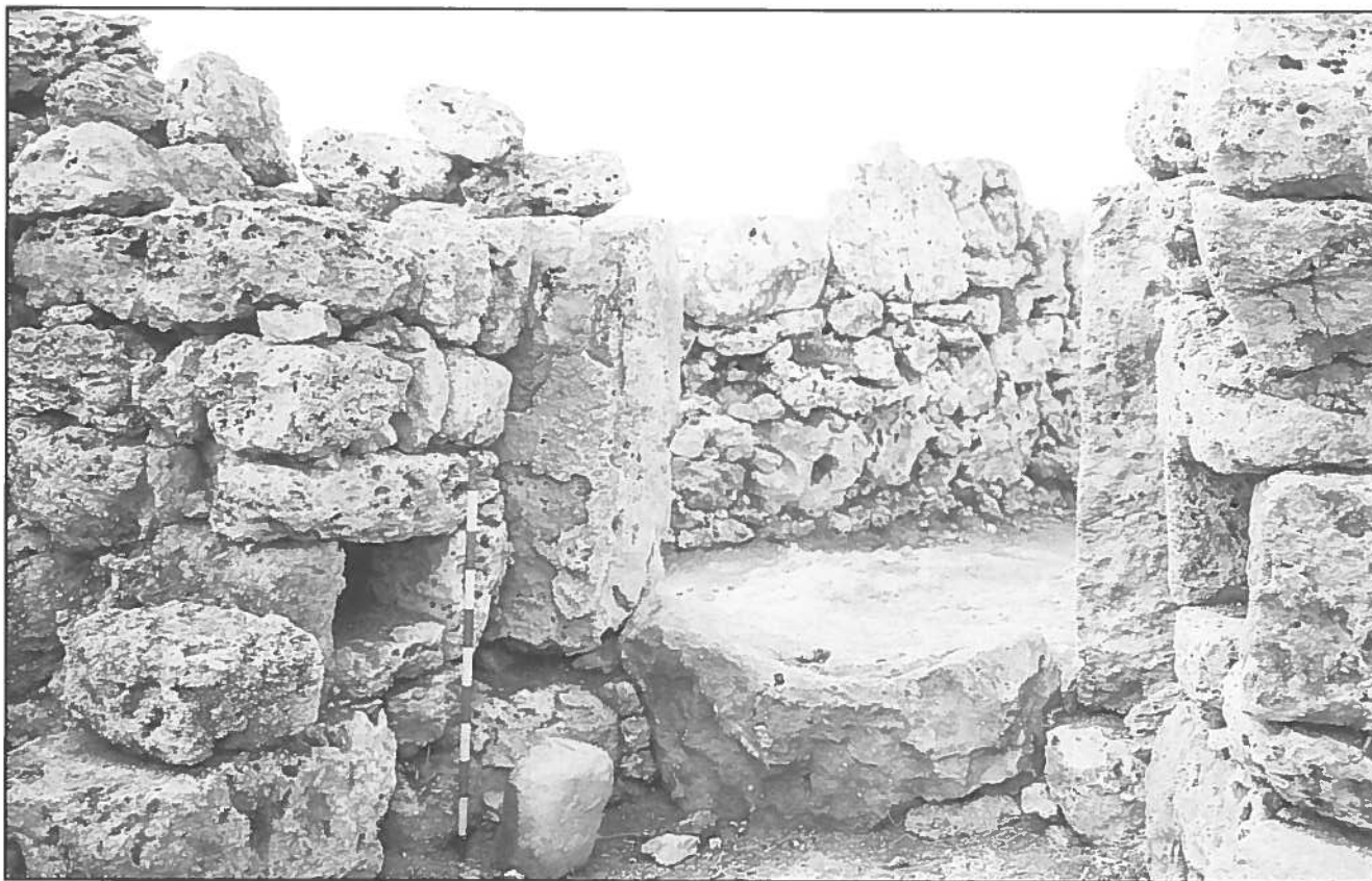
Pedra ovoide a l'entrada del Monument 5 de So Na Caçana (Alaior).