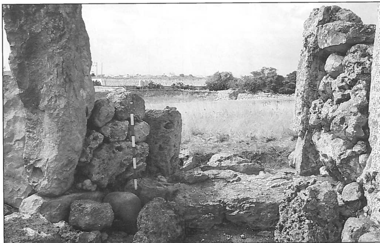
Pedra ovoide a l'entrada del Monument 2 de So Na Caçana (Alaior).