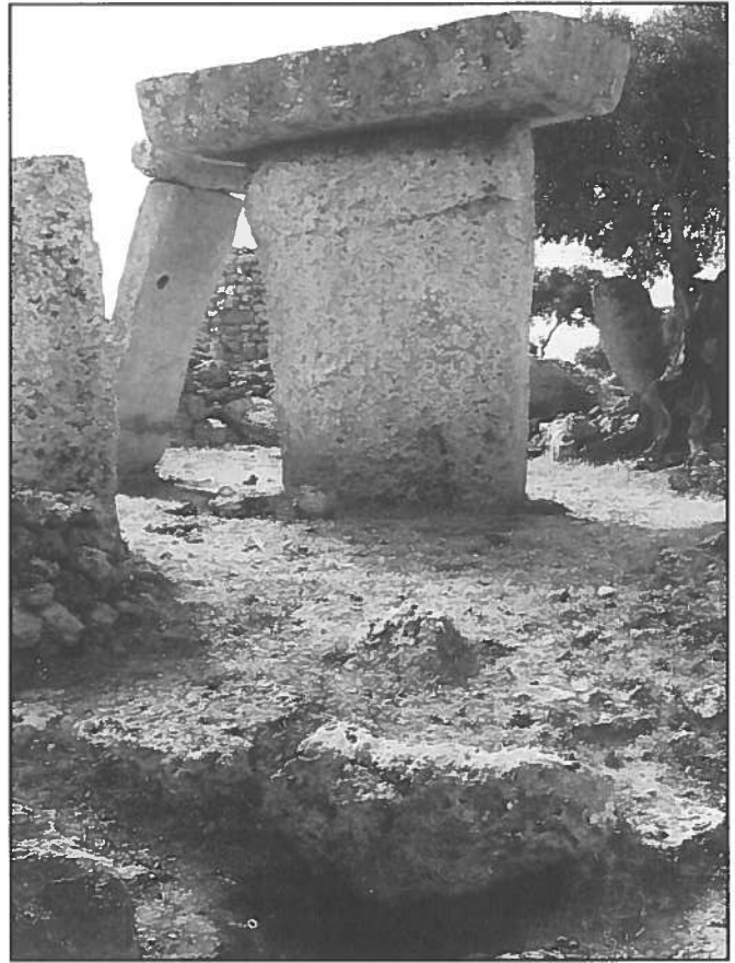
Concavitat excavada sota el recinte de la taula de Talatí de Dalt (Maó).