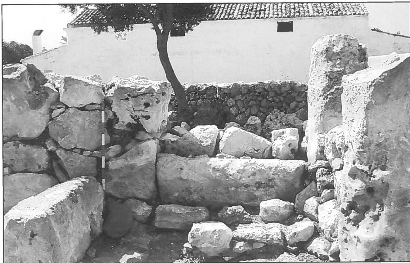
Pedra ovoide a l'entrada del recinte de la taula de Binissafullet (Sant Lluís).