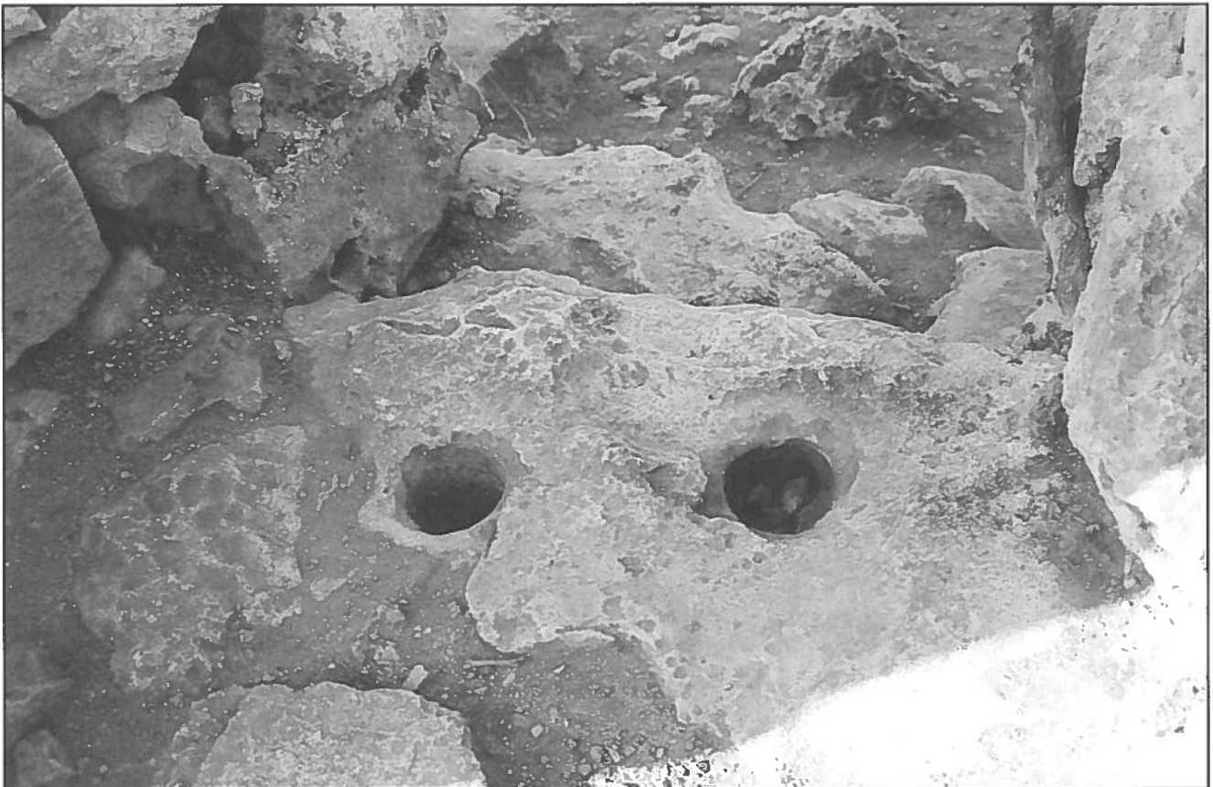
Concavitat excavada sota el recinte de la taula de Son Catlar (Ciutadella). Planimetria segons Lluís Plantalamor.