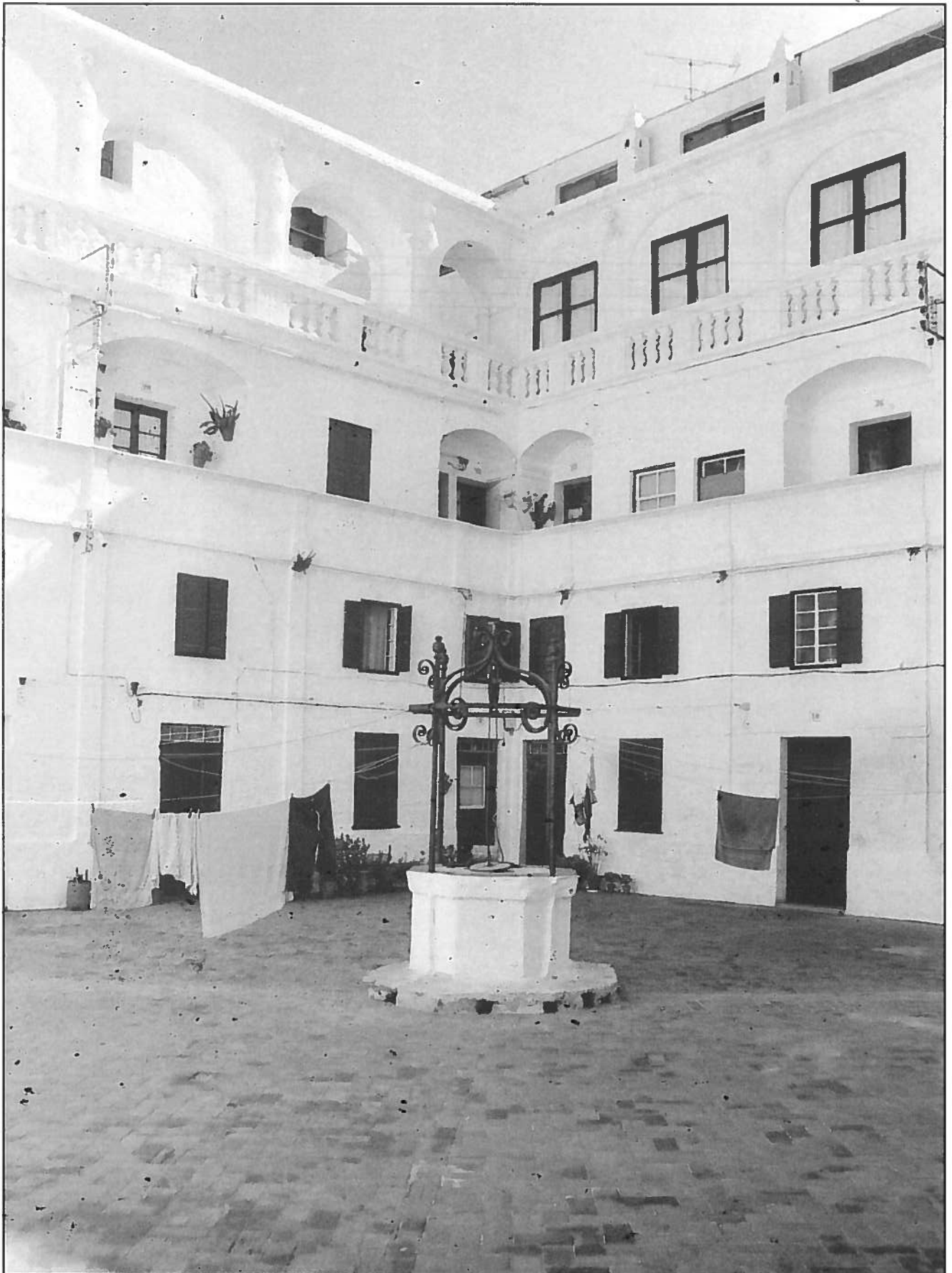
El pati de Sa Lluna, antic claustre del convent de Sant Diego