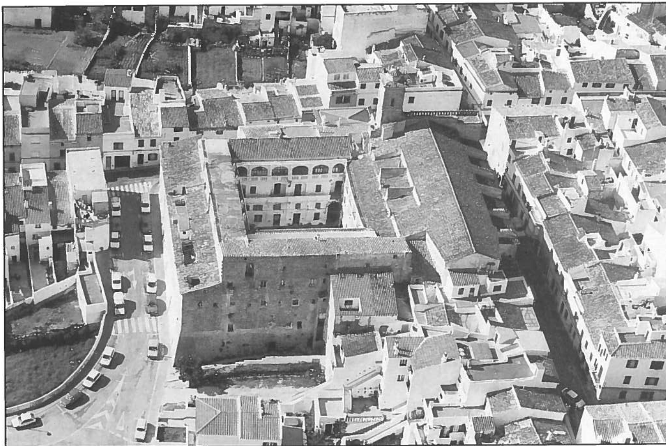
Vista aèria de l'església i el convent de Sant Diego, entre els carrers de ses Escoles, des Banyer i de Sant Diego