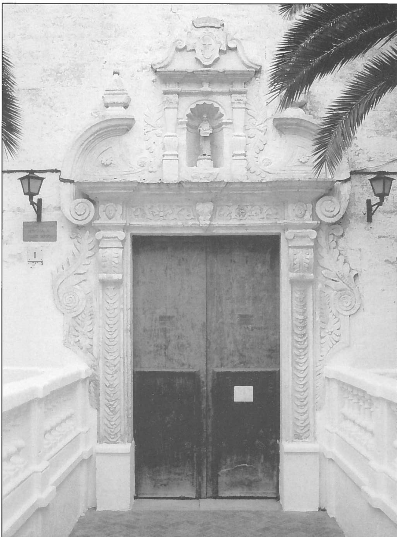
Porta major de l'església de Sant Diego