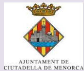
AJUNTAMENT DE CIUTADELLA DE MENORCA