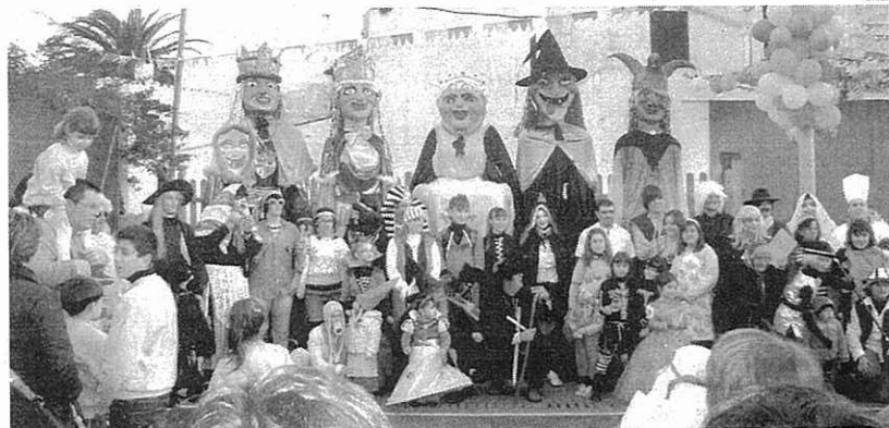
DESFILADA. La festa de disfresses es celebra a Lluçmaçanes des del 2009

DISSABTE AL PLA DE L'ESGLÉSIA AMB RUA, BALL I PREMIS