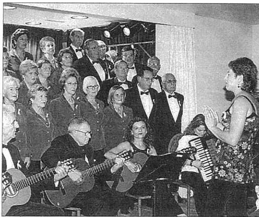
▲ Camino a Roma. La Coral del Centre Democràtic (en la foto en una actuación anterior) cantará el 10 de marzo en la Basílica de San Pedro y el 13 en Isola Tiberina de Roma.

Después de un par de días libres, la Coral volverá a actuar el domingo 13 de marzo a las once de la mañana, en una recepción que se realizará en Isola Tiberina (pequeña isla ubicada en el río Tiber justo a su paso por Roma), esta vez con temas populares españoles y tradicionales menorquines, con algún que otro guiño fuera de esas fronteras. Así, entre las canciones escogidas estarán temas como Ojos de España , O sole mio , No llores por mí Argentina , Himne a Menorca o S'aubada . El día siguiente, el 14, será ya día de retor-